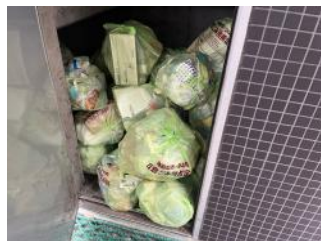
扉の中に捨ててください