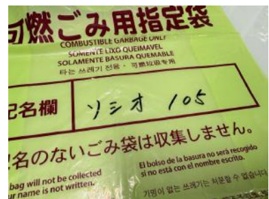
「ソシオ〇〇〇（部屋番号）」と記入します