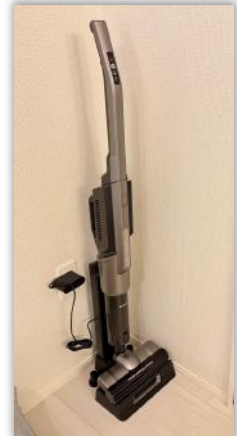
クリーナー・掃除機