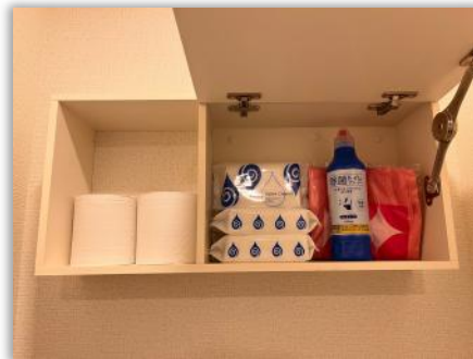
トイレの掃除用品も備えております