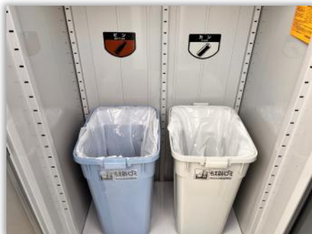
洗淨後※、扉の案内通りに分別して捨ててください（※臭いの原因となるため）