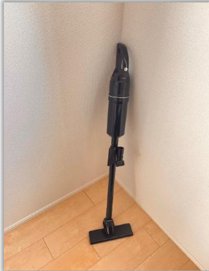
コードレスクリーナー 充電ケーブルを使用して、いつでも クリーニング可能です