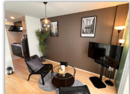
ツインルーム / リビング