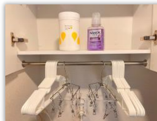
洗濯洗剤・ハンガーなど