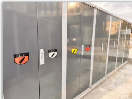
富士山側に倉庫があります