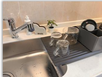
水切りプレート キッチンの棚にご用意しています