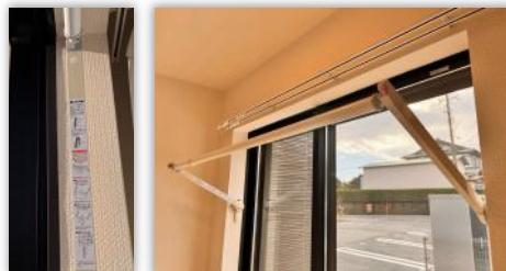
ホスメイト [アーム張り出しタイプ]