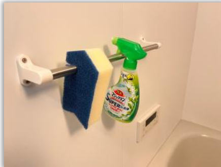
お風呂掃除用洗剤、スポンジ