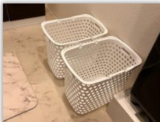
ランドリーボックス