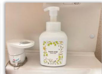
ハンドソープ・シャンプーなど