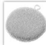
シンク洗いたわし