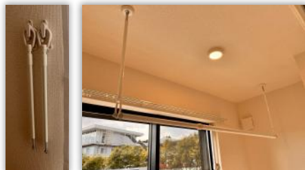
ホスメイト [天井吊り下げタイプ]