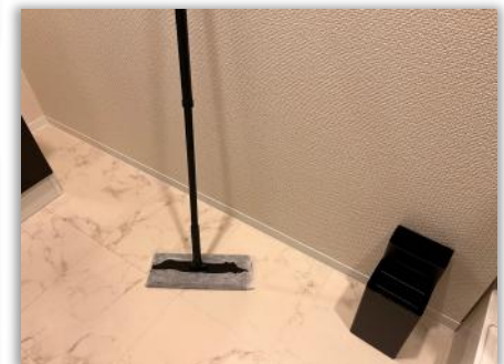
フローリングワイパー