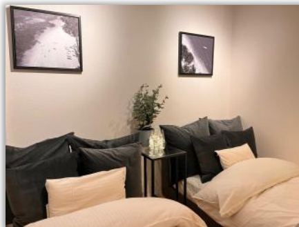
ツインルーム / ベッドルーム