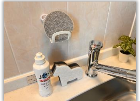
シンク・食器用洗剤、スポンジ