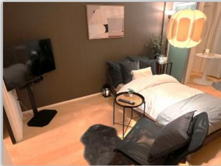
シングルルーム / リビング