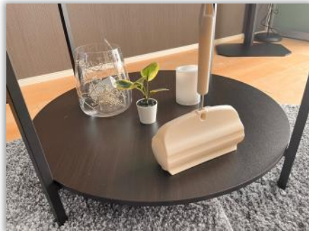
ココロ 髪の毛などにご利用ください